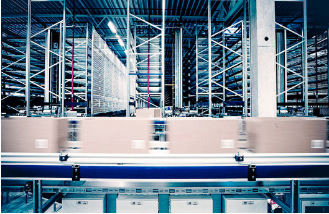
Convoyeur de triage de cartons automatique. Sortieranlage (Sorter) mit Kartons in Deutschland.

Meyer & Meyer propose des solutions logistiques intégrées sur place