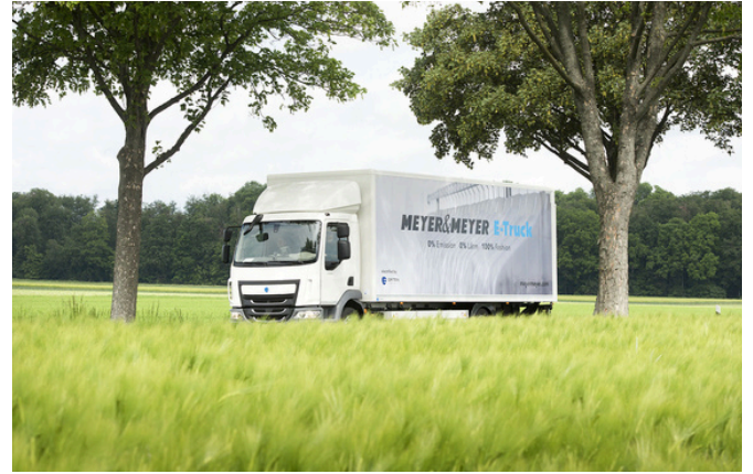
Un camion électrique avec batterie fixe circule en Allemagne. E-LKW mit fest integrierter Batterie fährt in Deutschland.

Osnabrück, 28 juin 2022 – En tant que spécialiste du transport, de l'entreposage et des services intégrés à valeur ajoutée, Meyer & Meyer vous propose des solutions logistiques adaptées à vos besoins individuels. Avec plus de 1400 collaborateurs, l'entreprise familiale compte parmi les principaux experts de la logistique de la mode et est un partenaire de croissance pour l'industrie automobile et des biens de consommation en Europe, en Afrique du Nord et en Asie occidentale. Les clients bénéficient d'une vision globale de leur modèle commercial avec des processus économiques et un traitement fiable.