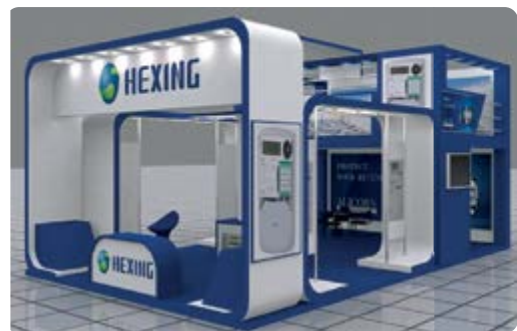
Exemple de stand personnalisé